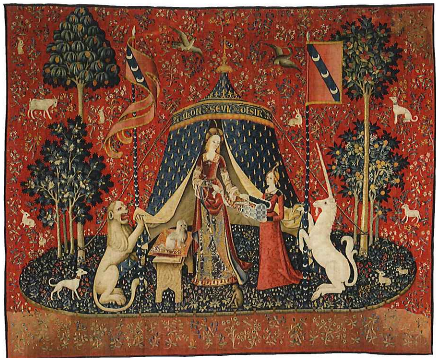
À mon seul désir, tenture de la Dame à la Licorne, RMN-Grand Palais (Musée de Cluny - Musée national du Moyen Âge) ©Michel Urtado

Certaines de ces photos feront l'objet d'agrandissements inédits présentés lors de l'exposition organisée le 30 septembre et le 1 er octobre à la Maison Jonathas, à Enghien. Cet événement sera bien sûr l'occasion pour les Éditions Wapica de présenter officiellement cette nouvelle publication, de proposer une séance de dédicaces de certains auteurs et d'échanger avec les amateurs d'art et de patrimoine.