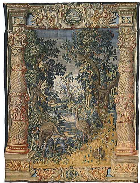
Scène forestières aux hérons, coll. Fonds Michel Demoortel, Fondation Roi Baudouin, en dépôt à la Maison Jonathas